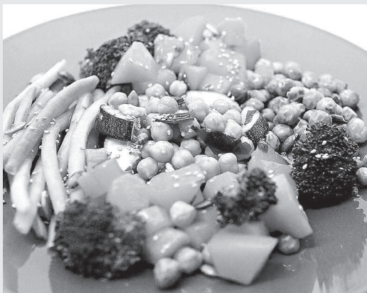
SANDRA ALONSO | FOTO OTILIA QUIREZA | TEXTO